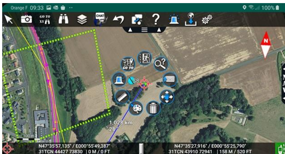
Interaction avec un objet dans la DELTA SUITE MOBILE