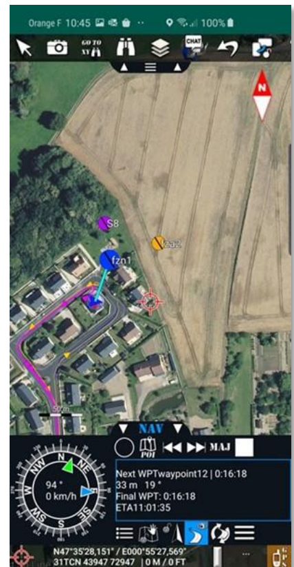
Outil de navigation de la DELTA SUITE MOBILE